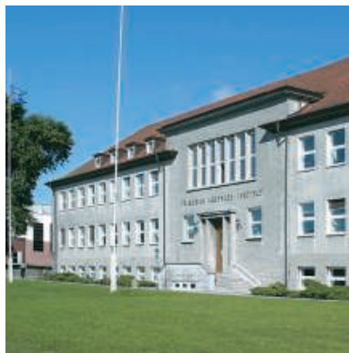
Das Friedrich-Loeffler-Institut ist das Referenzlabor für die Blauzungenkrankheit in Deutschland.

Die Blauzungenkrankheit ist eine anzeigepflichtige Tierseuche. Die Rechtsgrundlage für ihre Bekämpfung ist – neben den Vorschriften des internationalen Tierseuchenamtes (OIE) – die Richtlinie 2000/75/EG des Rates vom 20. November 2000, welche national in der Verordnung zum Schutz gegen die Blauzungenkrankheit vom 22. März 2002 umgesetzt wurde. Im Falle der Einschleppung der Blauzungenkrankheit ist mit weiträumigen Verbringungsverboten für Klauentiere und Massnahmen zur Insektenbekämpfung zu rechnen.