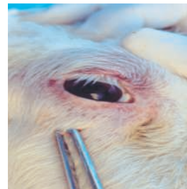
Gerötete und geschwollene Schleimhäute im Augenbereich