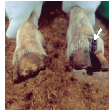
Schmerzhafte Veränderungen im Bereich des Kronsaums. Nach der Genesung kann es zu einem Bruch des Hufes kommen.

Ähnliche Krankheitsbilder (Differenzialdiagnose): Maul- und Klauenseuche, Schafpocken, Bovine Virus-Diarrhöe, Virusdurchfall der Rinder (BVD), Bösartiges Katarrhalieher, durch Pflanzenstoffe verursachte Photosensibilität und Vesikuläre Stomatitis.