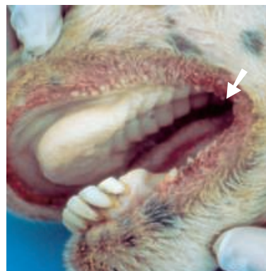
Blutung und Erosion am inneren Rand der Oberlippe

Die Schafe speicheln sehr stark und haben Schaum vor dem Maul. Die Zunge schwillt an und wird blau (Blauzungenkrankheit) und kann sogar manchmal aus dem Maul hängen.