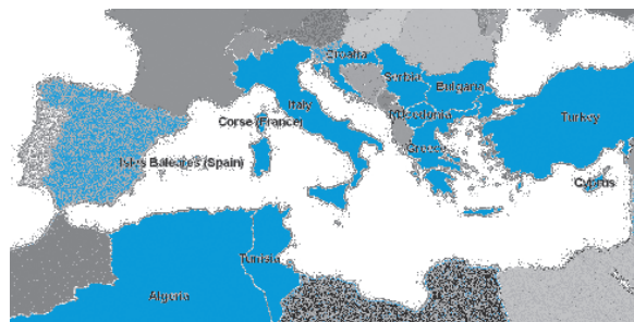
Verbreitungskarte der Blauzungenkrankheit in Europa.

Weltweit kommt die Blauzungenkrankheit vor allem in warmen Ländern zwischen dem 35. südlichen und dem 44. nördlichen Breitengrad vor. Die Krankheit ist bereits in viele Mittelmeer-Länder vorgedrungen.